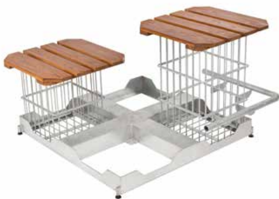
Plattenständer Dublin 8Z mit Multicube 40 (links) und Multicube 60 mit angeschweißtem Fußtritt (rechts).